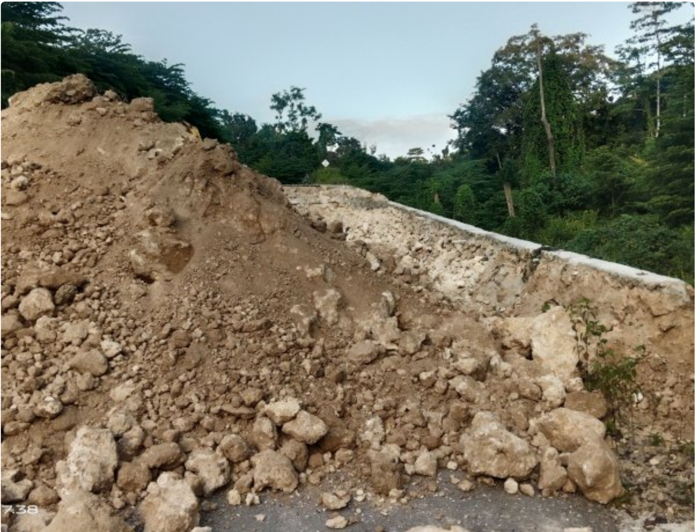
Pembongkaran Jalan Rusak Pada Pekerjaan Jalan Lingkar Anggaran 160 Milyar

Dugaan Menghilangkan Barang Bukti, Pembongkaran Jalan Rusak 160 Milyar, Satu Tahun Polda Sultra Melakukan Penyelidikan, Hingga Aksi Premanisme